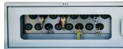
Armoire Deister Electronics