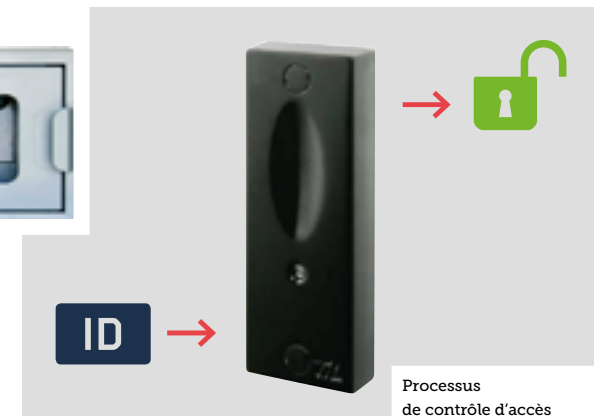
Processus de contrôle d'accès